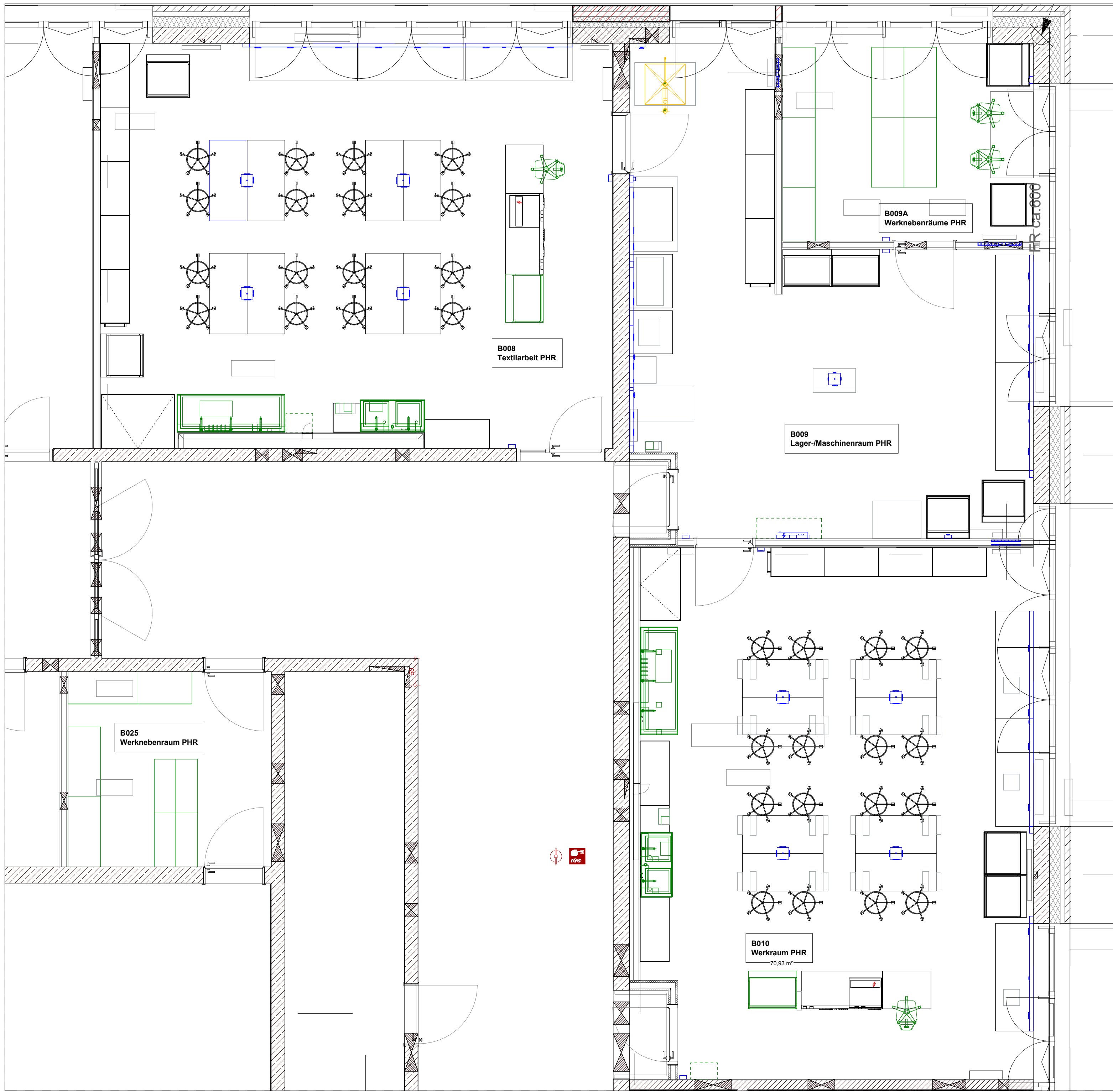
RT_FFB_00 PHR Bereich M 1 : 50